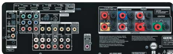
Un jeu de prises limité, mais suffisant pour bien des cas.